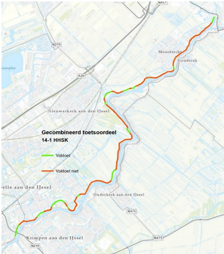
Afbeelding 1: Beoordelingsresultaat eerste landelijke beoordelingsronde (LBO1) van 2021 voor traject 14-1 in beheersgebied HHSK (rode gedeelte is huidige projectscope)